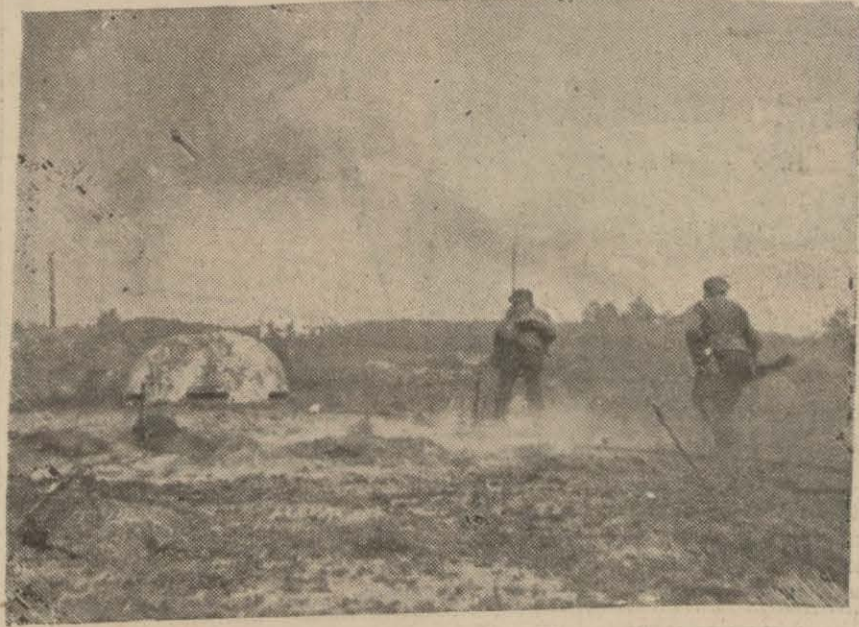
Fin cephesindeki Sovyet istihkamlarından biri Alman topçusu tarafından süstürüldükten sonra

Korkaklarla, bozuncularla mücadele ediniz! Sonuna kadar metin olunuz. İşe kadar mücadele ediniz! Zayıflık bilmezdir.»