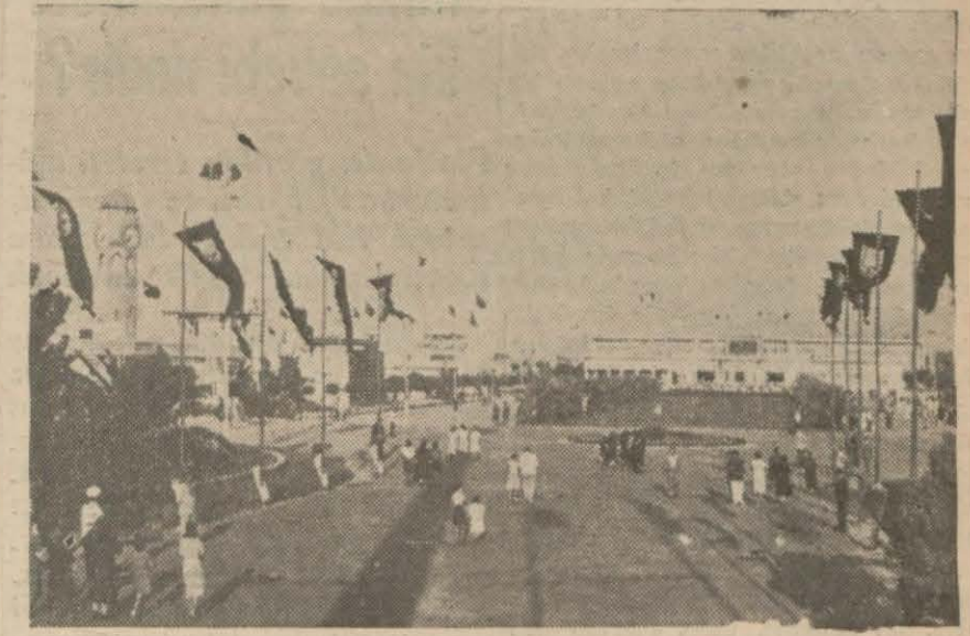
Fuardan bir görünüş

İzmir enternasyonal fuarının açıldığı bugün, asıl Türk milletine hitab etmek benim için haklı bir zevktir. [Devamı 5 inci sayfadadır]